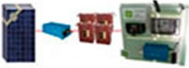
KIT ENERGIA SOLAR AUTOINSTALABLES PARA...